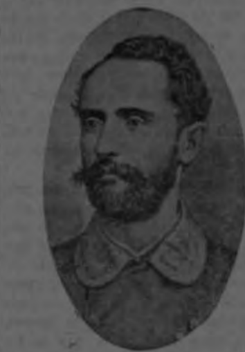
General don Tomás Guardia

restos del General Guardia, el 6 de Julio, aniversario de su muerte, fué perdiéndose y en los últimos años ya desapareció por completo perdiéndose la noción de aquel lugar en que descansan para la eternidad bajo el donzbo de nuestra Catedral los restos siempre queridos del General Guardia.